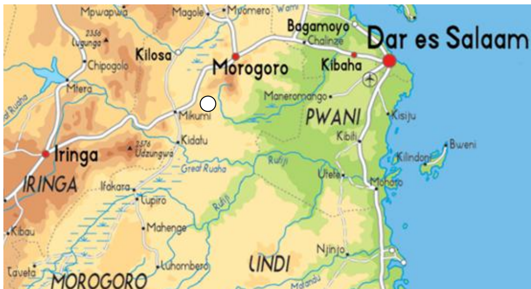
Fig. 9 : répartition géographique de Strictotarsus silvestrei n. gen., n. sp. (○ : localité type)

Strictotarsus silvestrei n. sp. n’est actuellement connu que des montagnes Vuma, situées à l’ouest de Mikumi en Tanzanie. Des collectes ciblées s’avèrent indispensables pour préciser l’extension de cette nouvelle espèce.