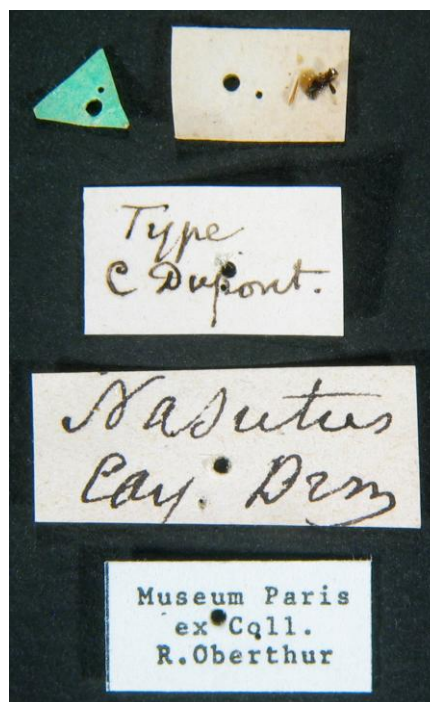
Fig. 1 : étiquettes portées par l'holotype d' Oxylygyrus nasutus (Burmeister).

10 mâles, 20 femelles (20-25 mm). 1♀, Camp Maïpouri, 26 VIII 2003, in TR ; 1♀, Ft. de la Crique Deux Flots, 10 IX 2001 in MD ; 1♀, Cayenne, 1926, in MNHN ; 1♀, Piste de la Crique Serpent pk10, 02 VIII 2016 in FD ; 1♀, Ft. de Patagai, 20 IX 1997, in MD ; 1♀, idem, 05 X 1997 ; 1♀, idem, 10 IX 2004 ; 1♀, Montagne des Chevaux, 12 X 2013, in FD ; 1♂, idem, 15 VIII 2014 ; 1♀, idem, 04 IV 2015 ; 1♂, idem, 28 VIII 2015 ; 1♀, idem, 05 IX 2015 ; 1♀, Montagne des Singes, 13 IX 1989, in MD ; 1♀, idem, 22 IX 1989 ; 1♀, Petit Saut, 20 VIII 1992, in MNHN ; 2♂1♀, Piste de Bélizon, 2016, in JG ; 1♀, Piste Counamama, 20 IX 1997, in MD ; 1♀, Piste des Compagnons, 18 III 1987, in MD ; 1♂, idem, 01 XI 1989 ; 1♀, Piste Wayabo,