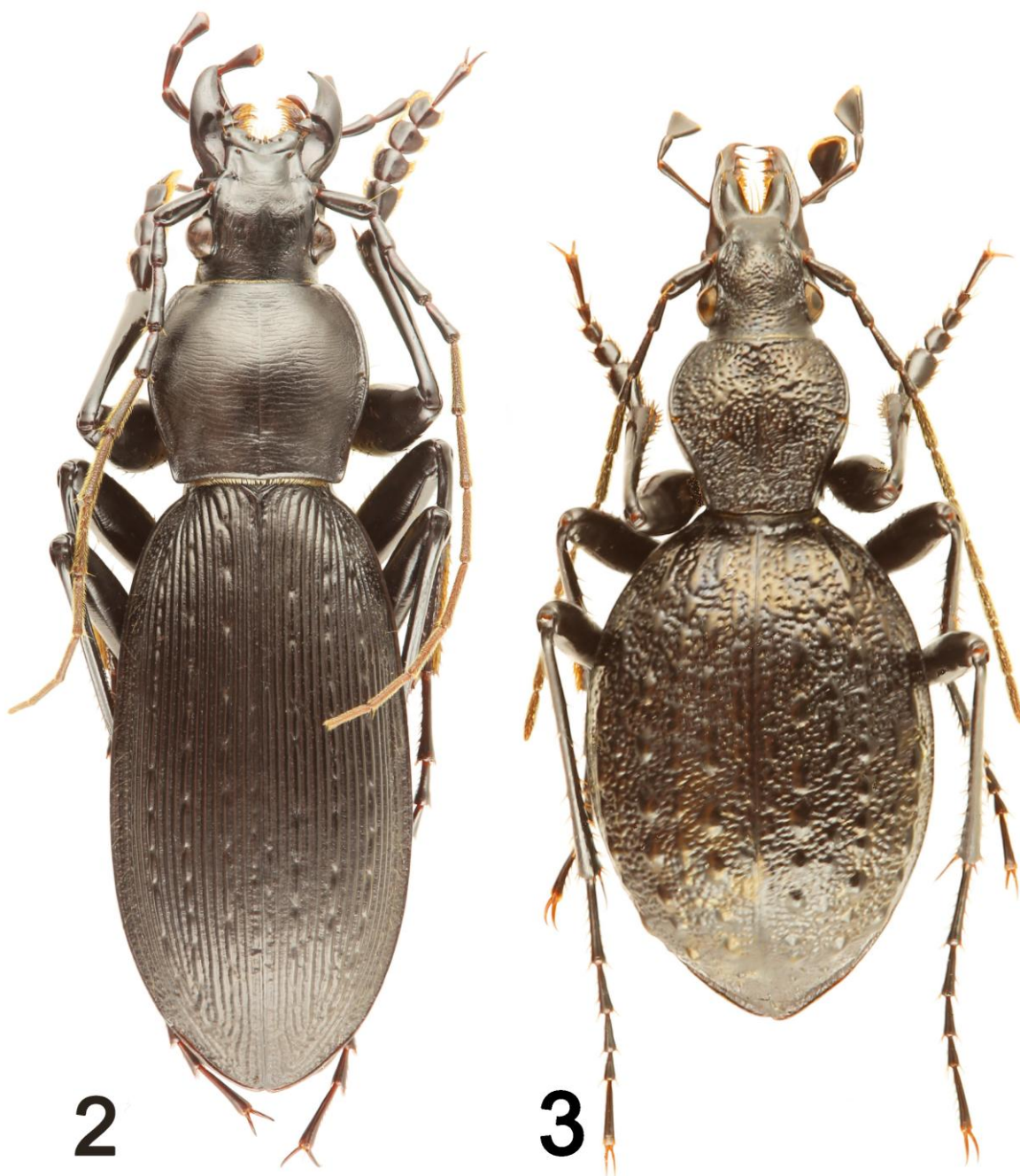
Fig. 2 et 3 : habitus des holotypes. – 2, Carabus (Apotomopterus) yundongbeicus mopanensis Deuve, n. subsp. – 3, Cychrus songpanensis subatzaopin Deuve, n. subsp.