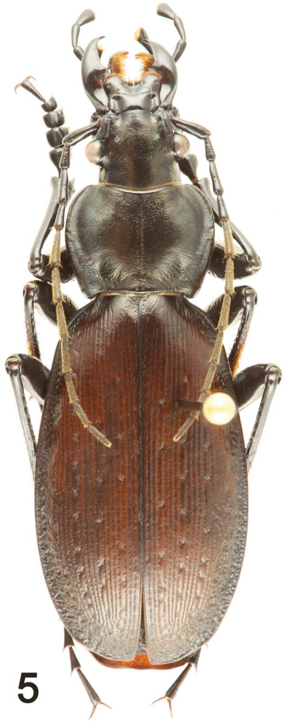
Fig. 4 et 5 : habitus des holotypes. – 4, Carabus (Procerus) scabrosus vardziaensis Deuve, n. subsp. – 5, C. (Tribax) daphnis boulbenellus Deuve et Stéfani, n. subsp.